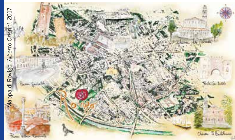
Mappa di Rovigo - Alberto Cristini, 2017

Aula Magna Cittadella Socio-Sanitaria Rovigo 29 - 30 settembre 2017